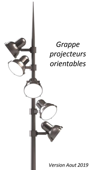
Grappe projecteurs orientables